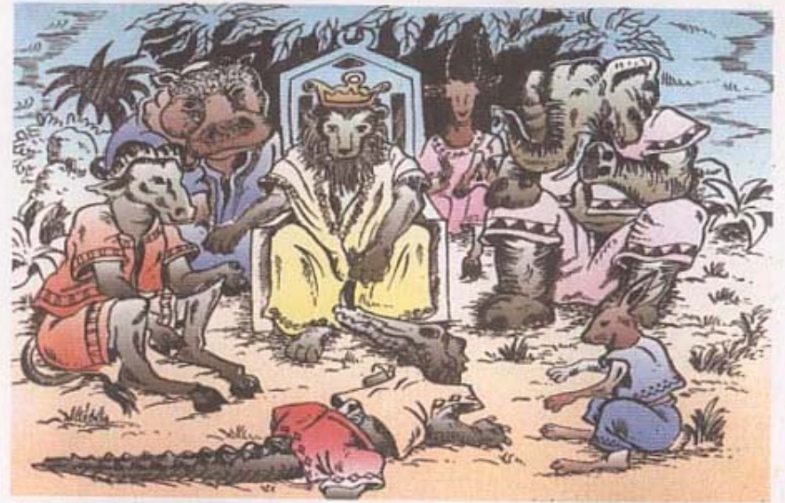
Le lion dans son palais, entouré de quelques notables dont l'éléphant, l'hippopotame, le caïman, le buffle, l'antilope, le lièvre etc. sont entrain de discuter de l'organisation de la fête annuelle.

Le roi les conseille ; pour être en bonne santé, soyons propres et entretenons bien notre environnement