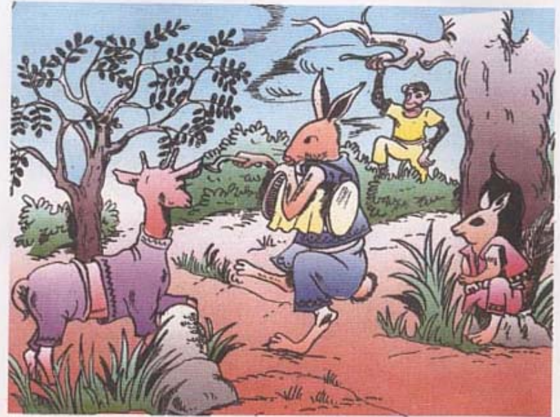
Le lièvre passa de gîte en gîte afin d'apporter la nouvelle. Des animaux devant leur gîte l'écoutent à son passage.