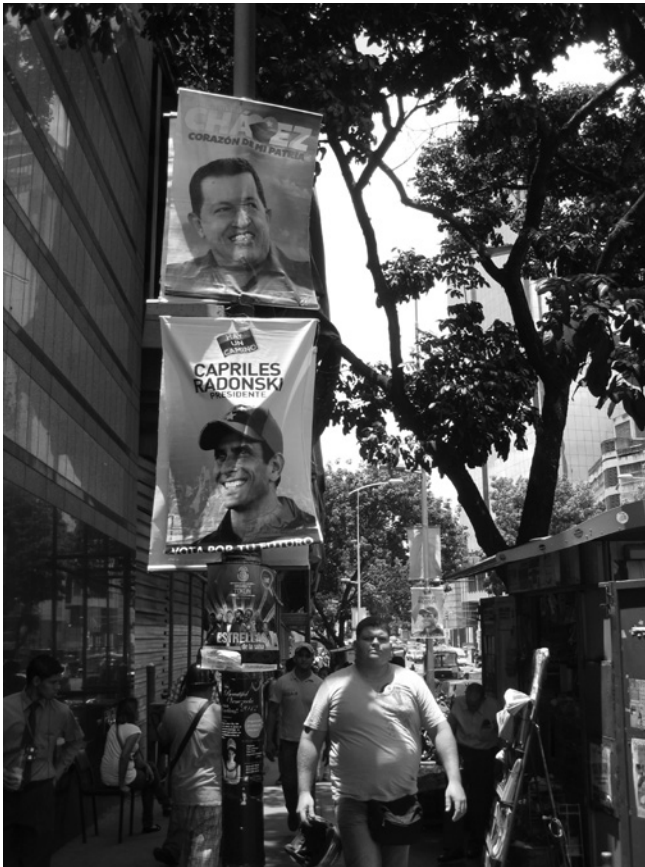
De la polarización al corazón de la patria

correspondientes al referéndum constitucional de 2007, las elecciones regionales de 2008 y las elecciones legislativas de 2010. La oposición comenzó también a moverse de un mensaje enteramente anti-chavista a la construcción de una estrategia alternativa de gobierno, articulada por primera vez en 2012 por Henrique Capriles Radonski.