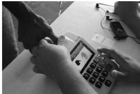
Un votante prueba el sistema biométrico de identificación el día 5 de agosto durante un simulacro

El sistema de votación venezolano es uno de los sistemas más altamente automatizados del mundo. Dicha automatización incluye todos los pasos del proceso, desde la inscripción de los candidatos hasta la identificación biométrica de los votantes en las mesas de votación, pasando por la emisión del voto en máquinas con pantalla táctil, la transmisión electrónica de los resultados y la tabulación centralizada de los resultados.